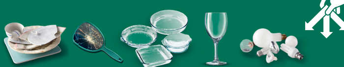
Vaisselle, céramique, pyrex, faïence, porcelaine, ampoules, vitres, miroirs, etc.