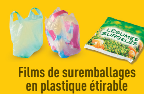
Films de suremballages en plastique étirable