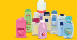
Emballages de produits d'hygiène

Bien vider, inutile de rincer. Pensez à laisser le bouchon sur vos bouteilles pour qu'ils soient recyclés eux aussi !