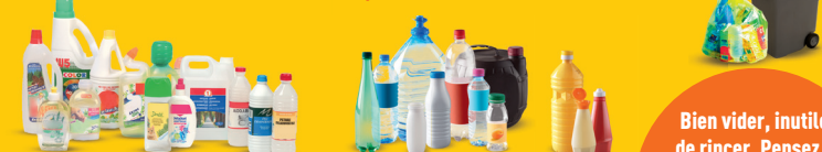
Emballages de produits d'entretien ménager

DIRECTION : LE SAC/BAC DE TRI DE COULEUR JAUNE