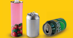
Bidons et canettes en acier et aluminium