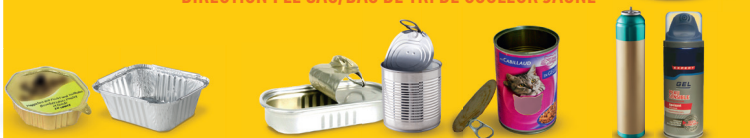
Barquettes en aluminium

DIRECTION : LE SAC/BAC DE TRI DE COULEUR JAUNE