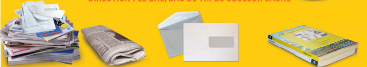
Journaux, magazines, revues, catalogues

DIRECTION : LE SAC/BAC DE TRI DE COULEUR JAUNE